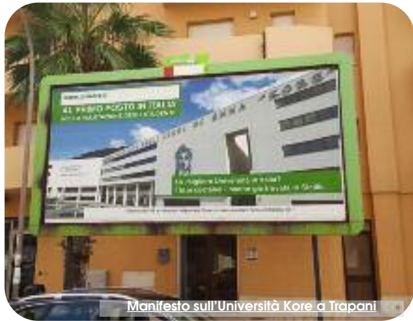
Manifesto sull'Università Kore a Trapani

"Qui - scrive Anton Cechov - ogni albero l'ho piantato io e mi sono cari. Ma ciò che importa non è questo, è il fatto che prima che venissi io qui non c'era che un terreno incolto e fossi pieni di pietrame e cardi selvatici. Ho trasformato quest'angolo perduto in un luogo bello e civile. Fra tre, quattrocento anni, tutta la terra si trasformerà in un bosco fiorito e la vita sarà meravigliosamente leggera e facile". Considerate le distanze che ci separano dal Giardino dei ciliegi del celebre scrittore russo e superata l'epoca della tecnica, per noi Siciliani, abitanti del villaggio globale, è lecito parlare di paesaggio e di spazi destinati al verde, a partire dalla posizione periferica che occupiamo? Difficile rispondere, soprattutto se si considera l'indifferenza di trattamento riservata a tali tematiche, malamente interpretate come risultato di una tendenza che conduce a una loro piatta omologazione. Proliferano, infatti, libri, riviste specialistiche e trasmissioni televisive al pari di quelle dedicate alla cucina. Tutti esperti nel confezionare formule toccasana che sono tutto e il contrario di tutto. A ben vedere, però, la qualità attuale del paesaggio appare condizionata da una ostinazione analoga a quella dei conoscitori d'arte che - citando F. Nietzsche - nel tentativo di salvarla finiscono con l'eliminarla, atteggiandosi a