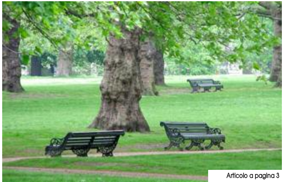
Articolo a pagina 3