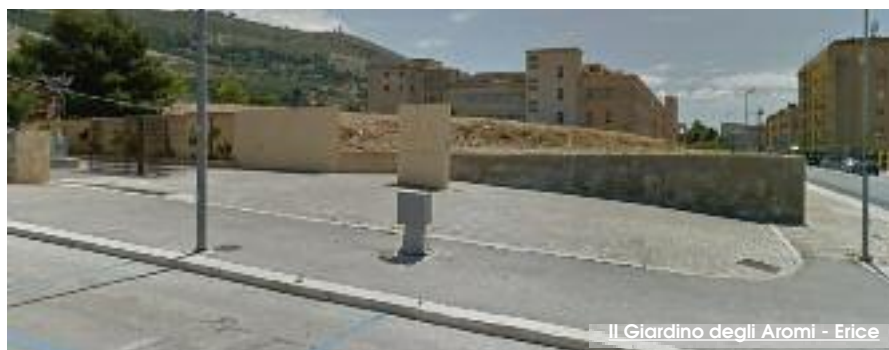
Il Giardino degli Aromi - Erice

Intendimento dell'amministrazione comunale è costituire una rete di organizzazioni no-profit per avviare la cogestione e la coprogettazione di attività sociali per promuovere la valorizzazione e la piena valorizzazione della struttura, rivolte prevalentemente ai giovani, ai minori, diversamente abili e alle fasce deboli mediante il recupero di uno spazio simbolico del quartiere, da anni purtroppo in con-