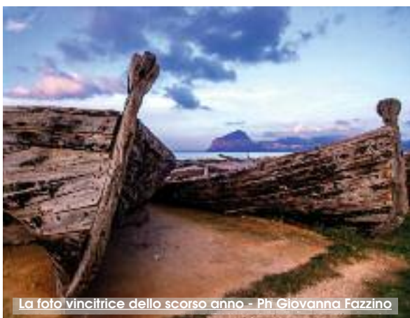
La foto vincitrice dello scorso anno - Ph. Giovanna Fazzino

Dalle nostre parti, le distese verdi delle campagne assolate rinfancano gli occhi dei visitatori e dei locali. Dalle nostre parti, l'azzurro mare, con il suo moto costante, sembra assecondare gli umori dei passanti. I monumenti si ergono possenti, come a simboleggiare un tempo sospeso tra presente e passato. "Dalle nostre parti. Gli splendori dei monumenti, del paesaggio, del mare, delle campagne", è il tema scelto in occasione del contest fotografico organizzato dalla Banca Don Rizzo della Sicilia Occidentale. Per preservare una tradizione avviata 13 anni fa, la banca intende "comporre" il suo calendario istituzionale del 2019 con le più belle immagini scelte tramite il contest fotografico. "La Banca Don Rizzo, nel tempo della globalità - spiega Sergio Amenta, presidente dell'istituto